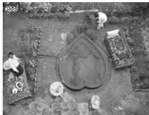
تصویر ۲. معماری انسان- محور حیاط خانه ایرانی در مقابل معماری بصر- محور نوگرا