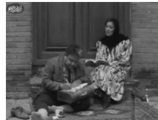
تصویر ۳. پاسخدهی به انواع فعالیت‌های اجتماعی عاملی برای حضور دسته جمعی افراد

در این خانه‌ها را فراهم آمده است. چهار نسل متفاوت با نیازها و فعالیت‌های گوناگون مستقر در خانه، حیاط را قرارگاهی برای رفع نیازهای خود یافته‌اند. مک‌اندرو این وضعیت را با عنوان حس جمعی بیان کرده و می‌نویسد: احساس تعلق داشتن به یک جمع، این احساس که همسایگان برای یکدیگر مهم هستند و برآورده شدن نیازهای آنها در گروه تعهد جمعی است (مک‌اندرو، ۱۳۸۷: ۳۳۲). مرد جوان که مشغول به کار خانگی است در کنار بازی پسر همسایه هیچ محدودیتی برای انجام فعالیت‌های دیگر خانوارها از جمله افراد مسن ایجاد نکرده است، همین عدم محدودیت با رعایت حریم برای بانوان نیز میسر شده است (تصویر ۴).