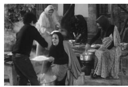
تصویر ۵. تامین نیاز به ارتباط با همسایه، کار دسته جمعی و اعتقادات مذهبی به عنوان بخشی از فرهنگ ایرانیان از طریق حیاط خانه‌ها

گونگونی را برای استفاده کنندگان بالقوه تامین می‌کند. ترکیب محیط، انگیزش بصری و لامسه و هم چنین انگیزش صوتی و بویایی را فراهم می‌آورد. علاوه بر این انگیزش‌ها، قابلیت‌های محیط ساخته شده از بعضی رفتارها حمایت می‌کند و رفتارهای دیگری را محدود می‌سازد. این قابلیت‌ها تقریباً نامحدود است (لنگ، ۱۳۸۱: ۹۴). آنچه که در فیلم "بچه‌های آسمان" در استفاده از قابلیت‌های حیاط بسیار مورد توجه بوده، توانش نمادین محیط است. "بچه‌های آسمان" روایتی صادقانه از عشق است. در این فیلم نیز به نظر می‌رسد که تنها لوکیشن و تنها عنصری که این قابلیت را دارد، حوض آب در مرکز هندسی حیاط خانه ایرانی است (تصویر ۶).