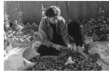
تصویر ۴. عدم تداخل در رفع نیازهای گروه‌های سنی و جنسیت‌های مختلف در حیاط خانه ایرانی

حیاط‌ها نماد و تمثیلی از بهشت بوده که در خانه‌های ایرانی، جلوه خاص خود را داشته‌اند. به تعبیری، طبیعت بهشت ایجاد می‌کند که مستور و رمزآلود باشد. به همین ترتیب خانه مسلمان با حیاط مرکزی محصور شده به همراه درختان و آب، مشابه جهان معنوی است. فیلم "یه حبه قند" با تمرکز بر جنبه‌های فرهنگی زندگی ایرانیان نمایشی از فعالیت‌های اجتماعی را در بستر حیاط خانه ایرانی را داشته است (تصویر ۵). در فیلم "هامون" برگزاری مراسم عزاداری در حیاط، در فیلم "مادر" ملاقات با همسایگان و اقوام در حیاط، و در فیلم "یه حبه قند" برگزاری مراسم ختم "دایی"، عروسی "پسندیده" دختر خانواده و هم چنین توجه به مسائل اعتقادی همچون برپایی نماز در حیاط خانه، مصادیقی از حضور لایه‌های فرهنگی در شکل‌گیری روابط اجتماعی در حیاط خانه ایرانی است.