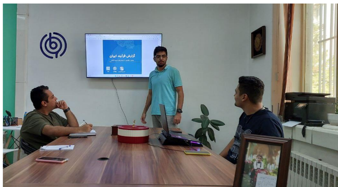
شکل ۱ جلسه‌ی گزارش فرایند سال ۱۴۰۱

این کمپین‌ها به بهبود شناخت محصولات و خدمات بهفالب، جذب مخاطبان جدید و پشتیبانی از مشتریان موجود کمک کردند. همچنین، به اشتراک گذاشتن تجربیات مفید و ارتقاء شناخت صنعت ارتباطی و همکاری با مخاطبان بین‌المللی کمک کردند.