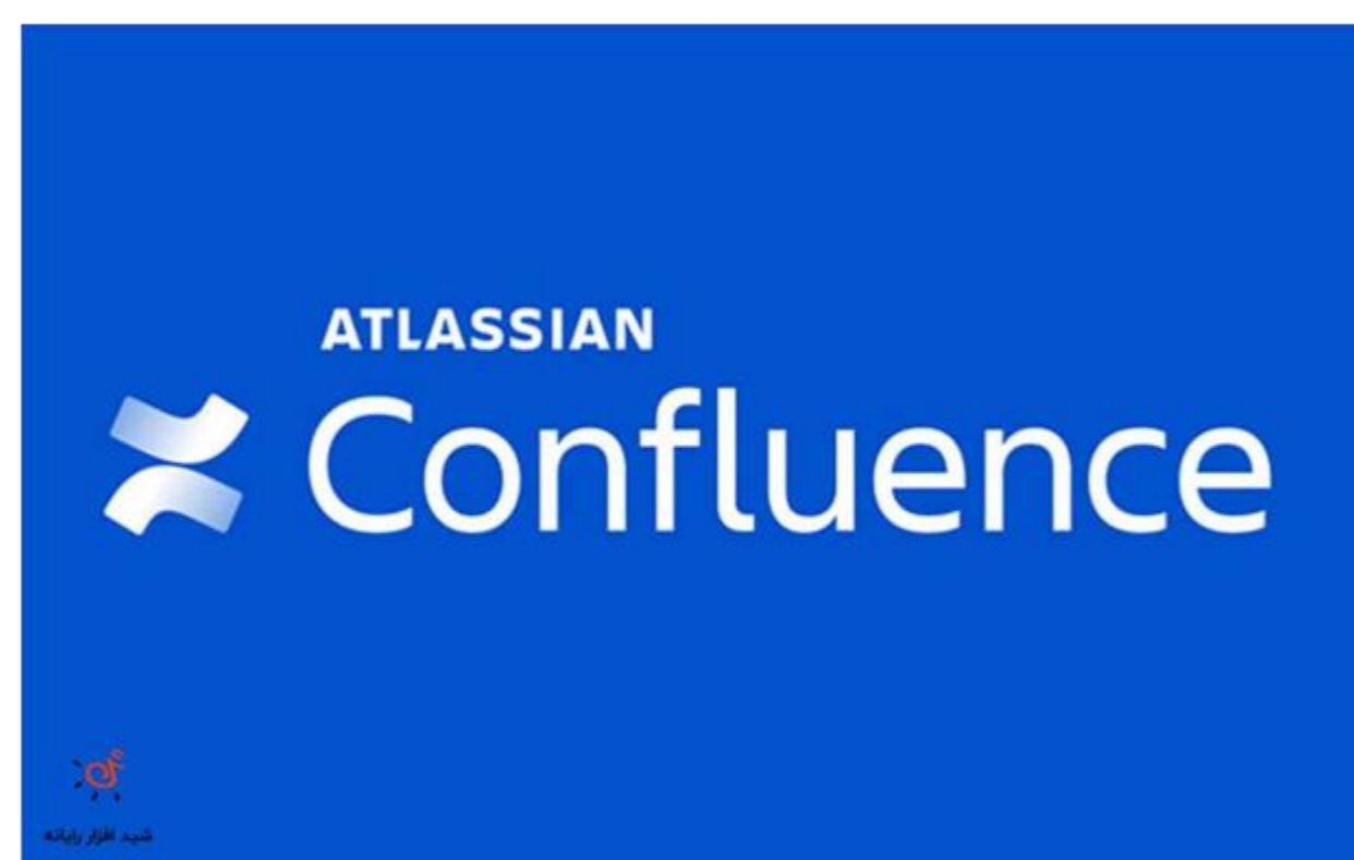
شکل ۲: لوگوی نرم افزار confluence